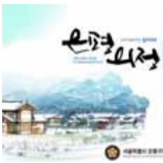
제7대 후반기 「은평의정」