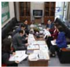
은평구의회 홍보물 편집위원회